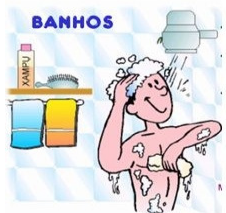
Tomar banho diário